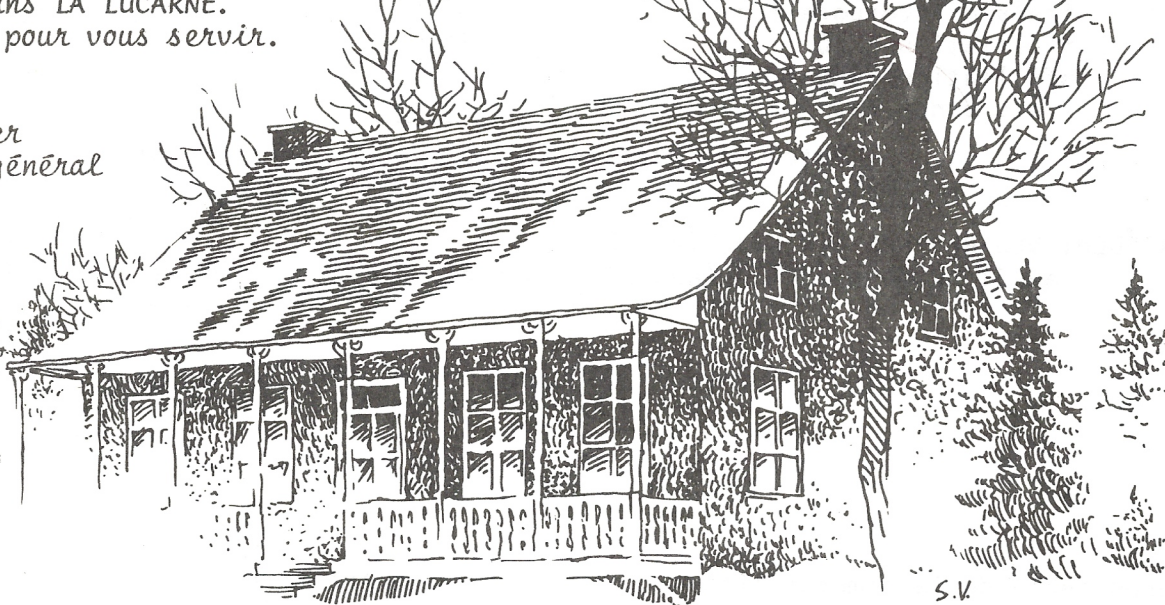
dessin de Serge Villeneuve